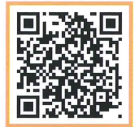
解密百業實境體驗網站