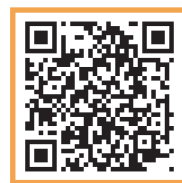
解密百業實境體驗網站